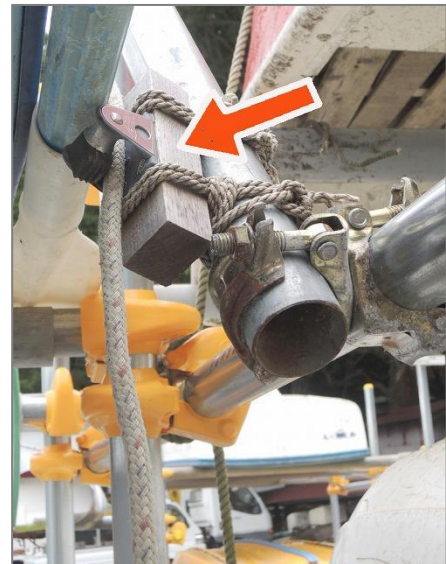
引き込んだロープを止めるカムクリート

「衣笠」の場合、三段目に乗せてあるテンダーを上げ下ろしするのにテークルの装置を考案した。そのためのブロックを取り付けるのには、三段目のパイプからさらに上に突き出した櫓を組み、その中間にそれを設備した。(写真上)