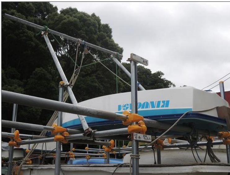
衣笠の上下架装置写真

ということからヨットマンである我々は、セーリングのギアと頭を使い少人数でもテンダーを上げ下ろしできる装置について考察してみよう。