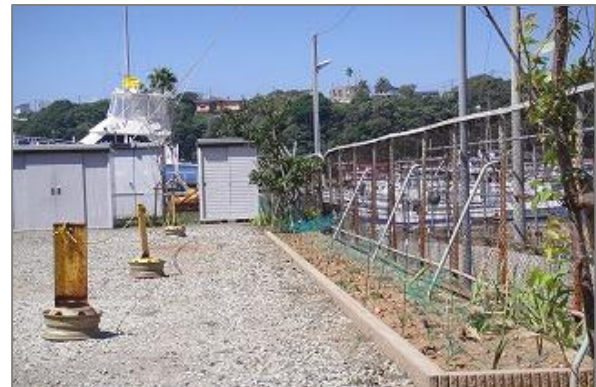
2-1 立札とトラロープの基本位置