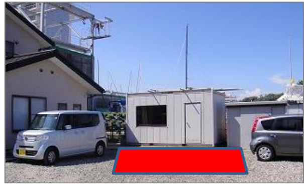
4-1 C区画は後向き駐車 ③ で1台のみ駐車可能。その他の場所は、町会専用区画につき駐車禁止