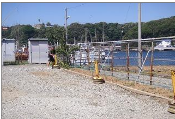
2-4 トラロープを張った状態を維持する