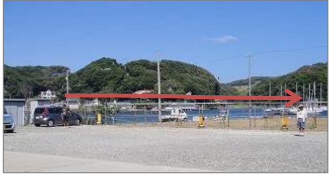
2-6 B区画は前向き駐車 ① で奥から7台まで普通車。8台目は小型車・軽自動車限定