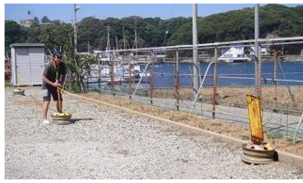
2-3 トラロープも花壇に接する位置へ