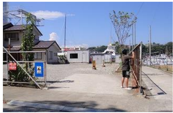
1-2 ロープをはずし、右側フェンスへ