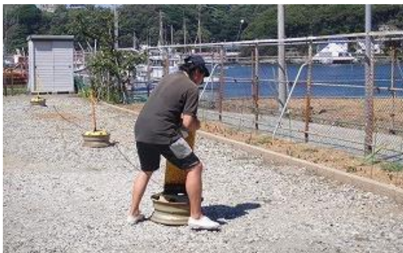
2-2 立札を花壇に接する位置に移動