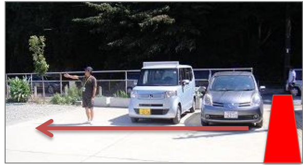
3-1 A区画は後向き駐車 ② で奥から8台まで普通車。9台目は小型車・軽自動車限定