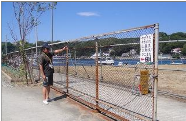
1-3 フェンスにかけておく