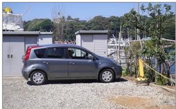
2-5 B区画 の駐車は 前向き駐車