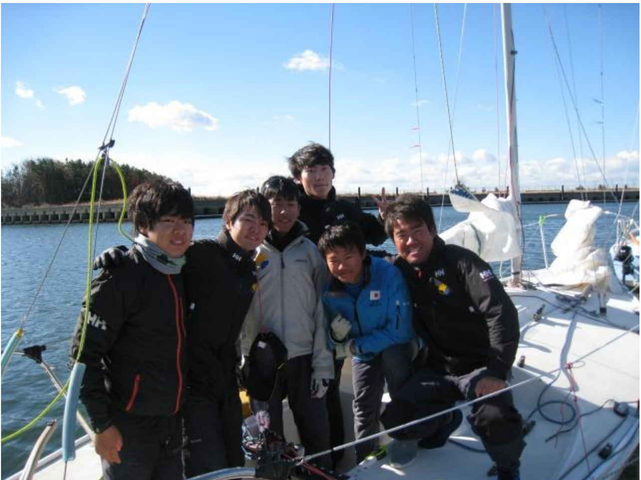
写真:仰秀の上級生の写真

仰秀は現在4年生1人、3年生2人、2年生3人で活動しており、学校がある期間は毎週土日、長期休みは週に5日間の練習を行っています。レースは主にJ/24 関東フリート主催のソーセージコースのフリートレースに参加しており、今年度だけで4回のフリートレースに参加しました。なかなか前を走れないレースが多いですが、社会人チームに食いつけるよう腕を磨いています。9月下旬に博多で開催されるJ/24 全日本選手権に参加する予定で、今年の夏休みもみっちり練習に励みます！