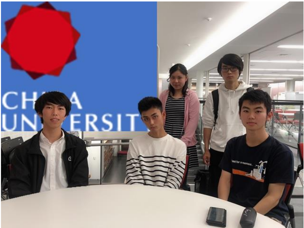
写真:“くろしお”1年生たちの写真

1年生が漕いで、フラフラしている“くろしお”のテnderにいつも「がんばれよ〜！」と声をかけてくださりありがとうございます。みなさまに優しく接していただき、練習をがんばられています。ぜひこれからも千葉大学ヨット部“くろしお”をよろしくお願いたします。