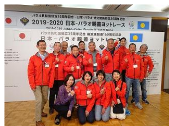
2019年12月28日懇親会 2019年12月29日横浜 多くの応援団に見送られスタート！