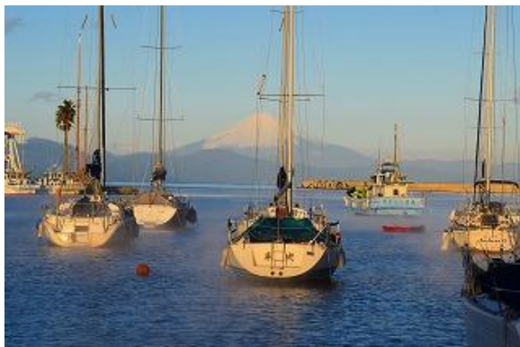
2021年12月 泊地から富士山を望む