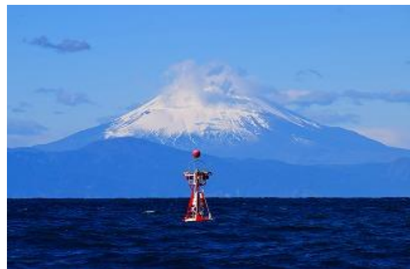
2021年12月 灯浮標と富士山

船内宿泊 早朝起床すれば小網代のいい景色がみられそうです。 傑作写真など撮られたらぜひお寄せください。 編集子