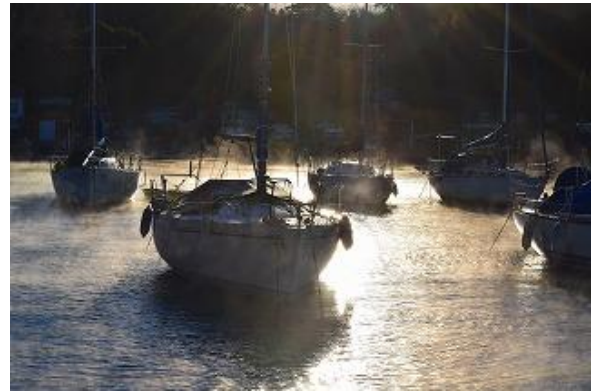
けあらし「波勝」周辺