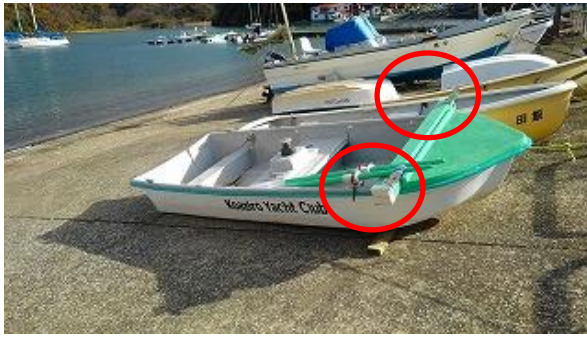
修理済の作業船写真

2021年暮れにKYC テンダーの修理を行いました。このテンダーは、繫留艇の管理、モニターの補修などの作業時に有効利用をするために、船首部に揚錨用のローラーを増設しました。