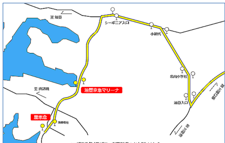
※京浜急行バス 新設線のお知らせから

朝早い時間には、小網代だけでなく、油壺や諸磯方面のセーラーやその先の釣り場を目指す人で混むのかとちょっと心配です。