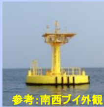
参考:南西ブイ外観

St-灯 (左に見て) - 南西ブイ (左にみて) - 灯 (右にみて) - F n